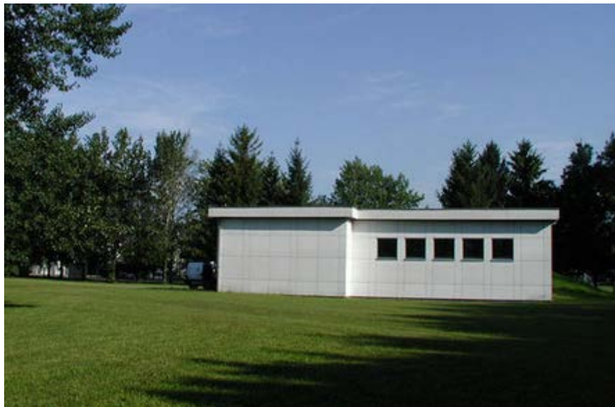
Wasserwerk der Gemeinde Lauterach, Wasenweg 1, 6923 Lauterach